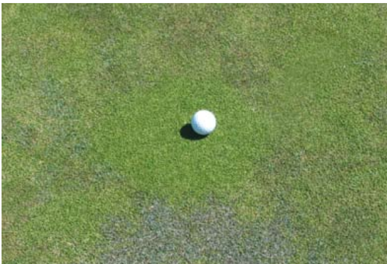
Los greenes de especies mixtas no ofrecen condiciones de juego estables de una temporada a otra, ya que una variedad prospera y otra decae..

Atendiendo a dicho ejemplo y asumiendo el empleo de máquinas de siega manuales, se estima que un Greenkeeper segaría aproximadamente 200 veces durante un año