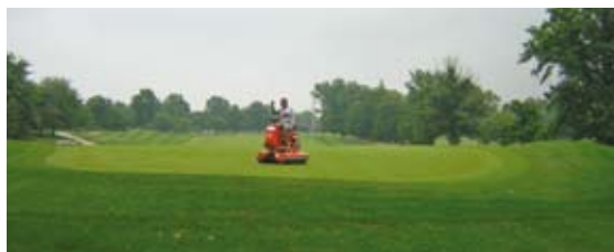
El rulado de greens es una práctica común para mejorar la suavidad de la superficie y aumentar las distancias de rodadura de la bola. Se estima que el rulado de greens se realiza unas 70 veces al año con un coste total de unos 1993€.

de agua, etc.) no se han incluido en estos cálculos.