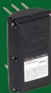
Sensor TURF GUARD