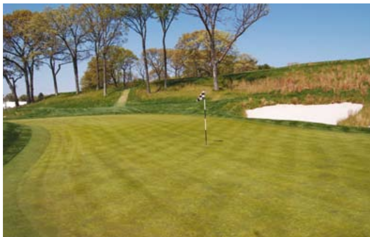
Los greens suelen plantarse con Agrostis stolonifera , pero con el tiempo la Poa annua suele invadirlos y convertirse en la especie dominante.

El Agrostis stolonifera destaca por su abundante densidad, su capacidad de auto recuperación, su adaptación a una gran variedad de condiciones climáticas y su color verde. Aunque no se suele establecer de forma intencionada, la Poa annua posee características muy similares al Agrostis stolonifera en cuanto a densidad y adaptación a un mantenimiento intensivo. Ambas especies son susceptibles a numerosas enfermedades y requieren la aplicación de productos fitosanitarios para mantener unas superficies de máxima calidad en dicha zona fría-húmeda. Parece ser que la Poa annua es más susceptible a muchas enfermedades y menos tolerante al frío y al calor que el Agrostis stolonifera . Otros inconvenientes de la Poa annua son su color verde manzana y la cantidad de semillas que produce en primavera. Estas semillas alteran la uniformidad y suavidad de