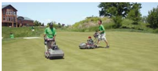
Durante un año normal, los Greenkeeper de la zona fría-húmeda siegan aproximadamente 200 veces.

Una superficie uniforme y firme que drene bien son características fundamentales para cualquier green de alta calidad. La aireación es necesaria para aliviar la compactación y gestionar la materia orgánica. Tanto el Agrostis stolonifera como la Poa annua pueden acumular un exceso de materia orgánica en la capa superior del suelo, lo que puede llegar a perjudicar su desarrollo a largo plazo. Por tanto, la aireación es una práctica agronómica tradicional fundamental que suele realizarse dos veces al año independientemente de la variedad objetivo. Los costes asociados a un pinchado adicional en verano (pinchado macizo, aspirado, inyección