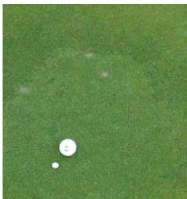
Tanto el Agrostis stolonifera como la Poa annua pueden formar una capa densa de césped con un mantenimiento intensivo.

de crecimiento normal (1 de marzo – 15 de noviembre) y pasaría el rulo unas 70 veces. Un estudio anterior en la zona de transición mostró que en Tennessee se realizaron una media de 216 siegas (13). En comparación, para greens de Agrostis stolonifera var. Penn A-4 sometidos a un mantenimiento intensivo en Virginia Beach, Va., la siega (simple o doble) se realizó en 262 días y el rulado sencillo en 157 días (9).