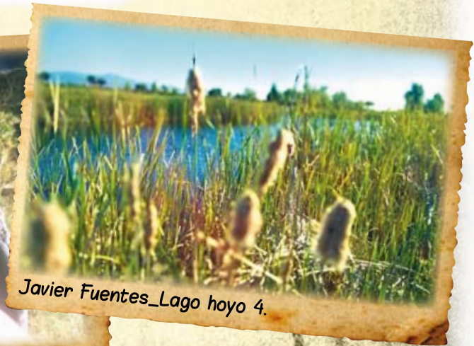
Javier Fuentes_Lago hoyo 4.