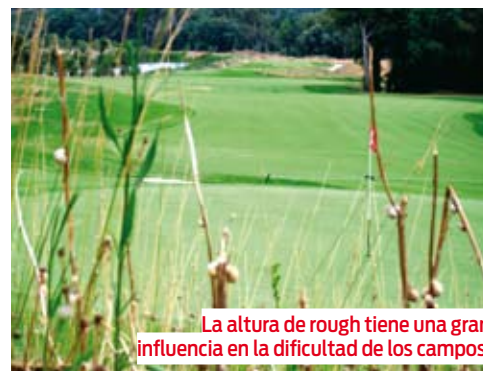
La altura de rough tiene una gran influencia en la dificultad de los campos.

En todo momento estamos hablando de incrementar la dificultad del campo, pero si los cambios antes descritos irían en el sentido contrario, es decir, facilitando el campo, la variación esperada sería de la misma cantidad pero en sentido contrario. En el cuadro 1 se muestra un resumen de los cambios y de la variación de la dificultad del campo