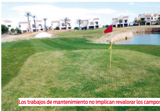
Los trabajos de mantenimiento no implican revalorar los campos.

Sí, se pueden valorar y es una práctica muy común. Pero es un error pensar que se pueden hacer una valoración para niños y/o 'superseniors'. Las valoraciones de campos son para hombres y/o para mujeres y dentro de cada sexo, los pueden utilizar cualquier tipo de jugador independientemente de su edad.