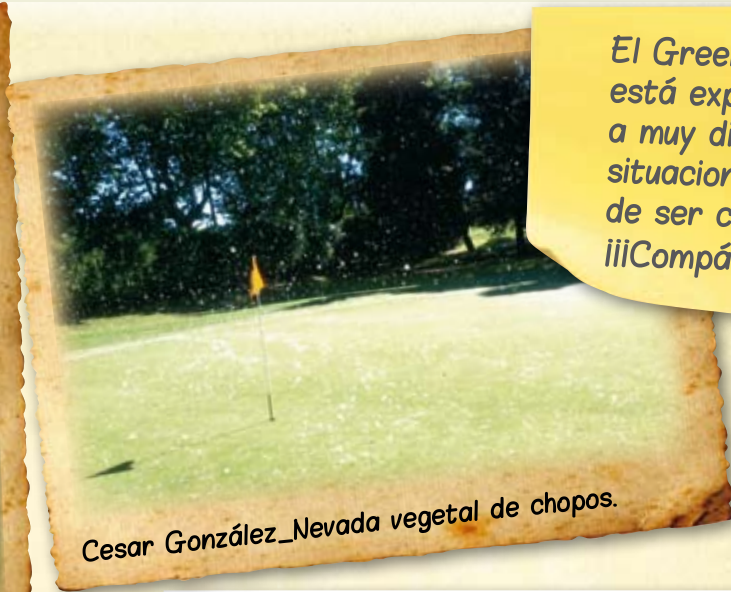
Cesar González_Nevada vegetal de chopos.