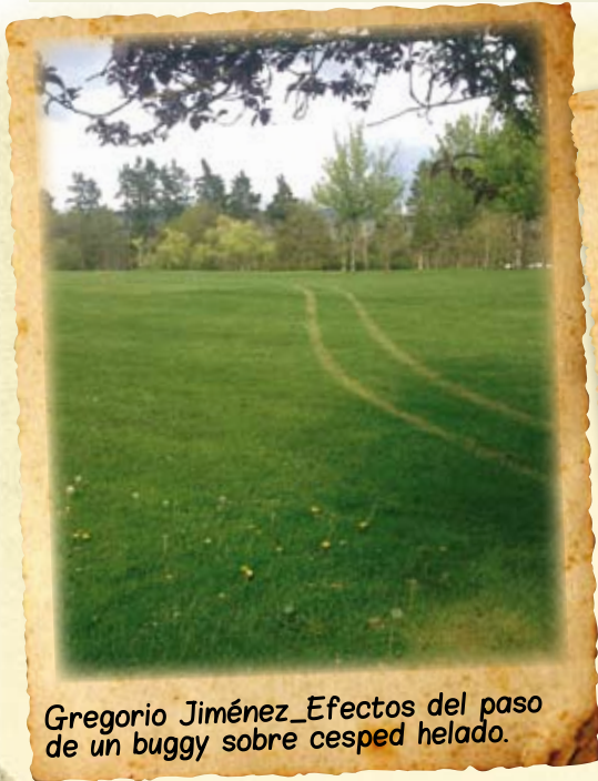
Gregorio Jiménez_Efectos del paso de un buggy sobre cesped helado.

El Greenkeeper está expuesto a muy diversas situaciones dignas de ser captadas. ¡¡¡Compártelas!!!