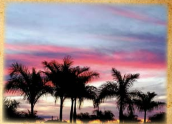
Pablo Lopez_Amanecer en Meloneras Golf

Para fomentar la participación de sus asociados en esta sección, la AEdG premiará, coincidiendo con el próximo Congreso, la mejor fotografía publicada. Haznos llegar tus imágenes al email info@aegreenkeepers.com