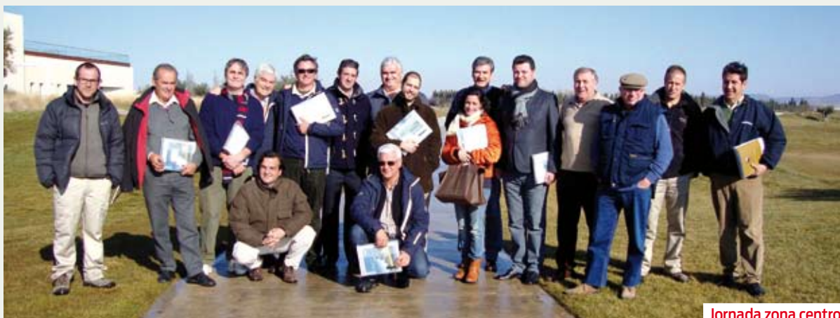
Jornada zona centro.