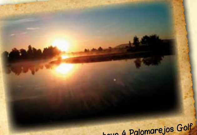
Javier Fuentes_Amanecer hoyo 4 Palomarejos Golf

El Greenkeeper está expuesto a muy diversas situaciones dignas de ser captadas.