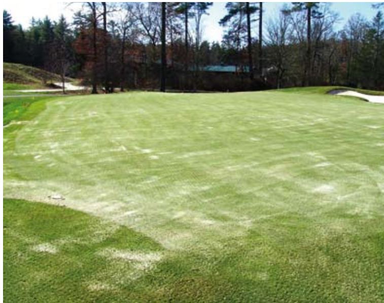
Un putting green de Bermuda recién pinchado. Esta labor es necesaria para mitigar los efectos de la compactación provocados por el tráfico de jugadores y maquinaria.

El uso de céspedes altamente estoloníferos (como las variedades de Bermuda ultradwarf) para