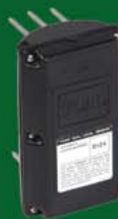
Sensor TURF GUARD