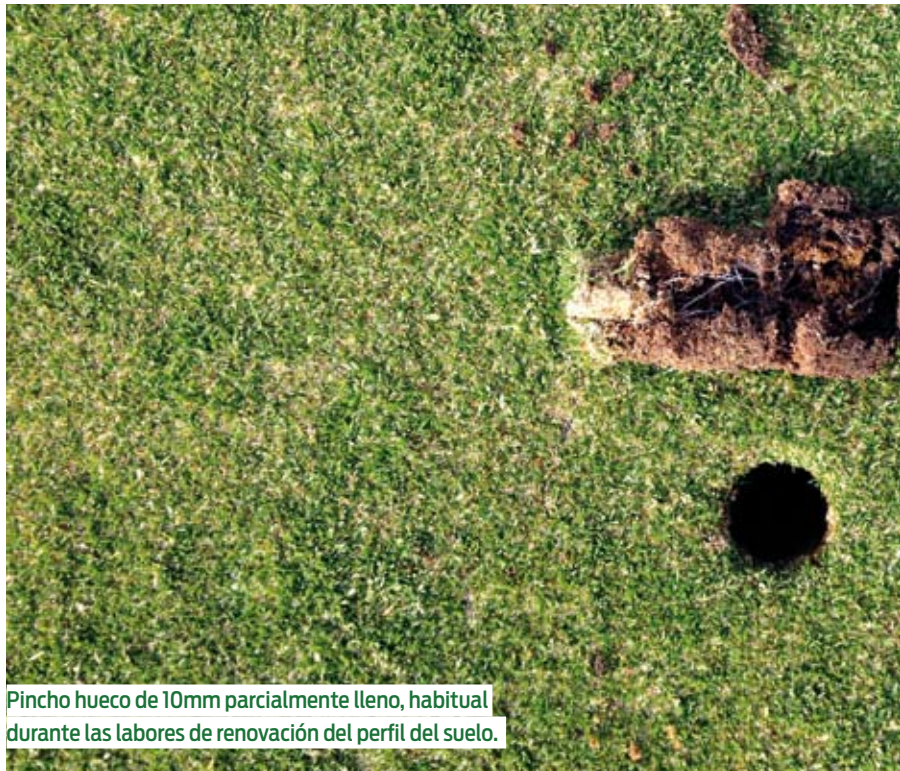
Pincho hueco de 10mm parcialmente lleno, habitual durante las labores de renovación del perfil del suelo.

Puede ser erróneo asumir que lo que siempre ha funcionado en un lugar puede ser igual de eficaz en otro.