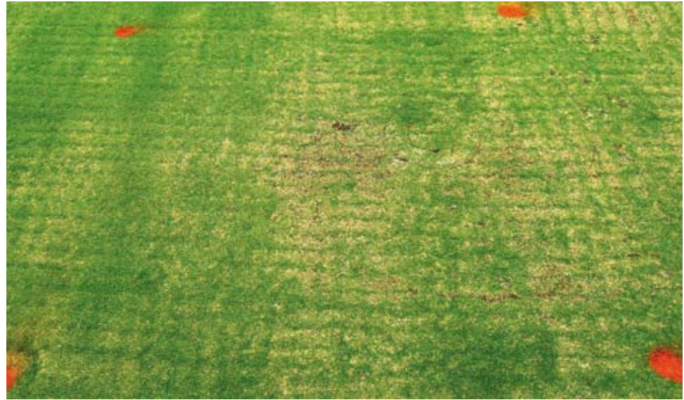
Dos semanas después del tratamiento para retirar el 25% de la superficie en un sólo pinchado. El aumento de la superficie afectada con el pinchado reduce la densidad aparente, mejora la infiltración de agua en superficie y disminuye la firmeza de la superficie, además de aumentar el tiempo de recuperación.

La infiltración se midió 14 días (+/- 2) después de cada pinchado utilizando un infiltrómetro de doble anillo. La infiltración (pulgadas/hora) se describe como el tiempo que el agua del anillo central tarda en vaciarse desde una altura de 8 cm mientras se mantiene una carga hidráulica en el anillo exterior.