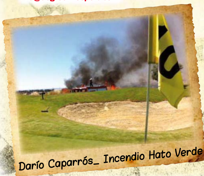
Darío Caparrós_ Incendio Hato Verde