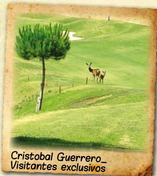
Cristobal Guerrero_ Visitantes exclusivos