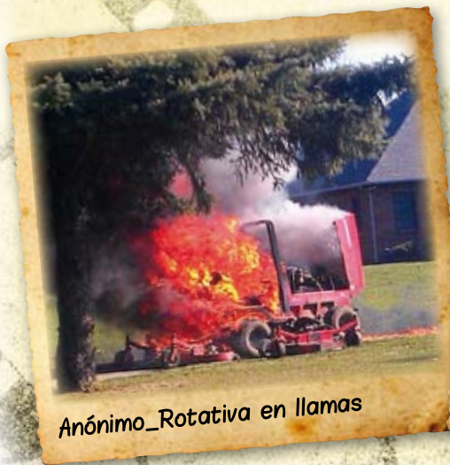
Anónimo_Rotativa en llamas

Para fomentar la participación de sus asociados en esta sección, la AEdG premiará, coincidiendo con el próximo Congreso, la mejor fotografía publicada. Haznos llegar tus imágenes al email info@aegreenkeepers.com