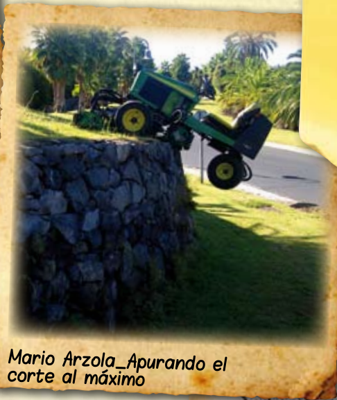
Mario Arzola_Apurando el corte al máximo

El Greenkeeper está expuesto a muy diversas situaciones dignas de ser captadas. ¡¡¡Compártelas!!!