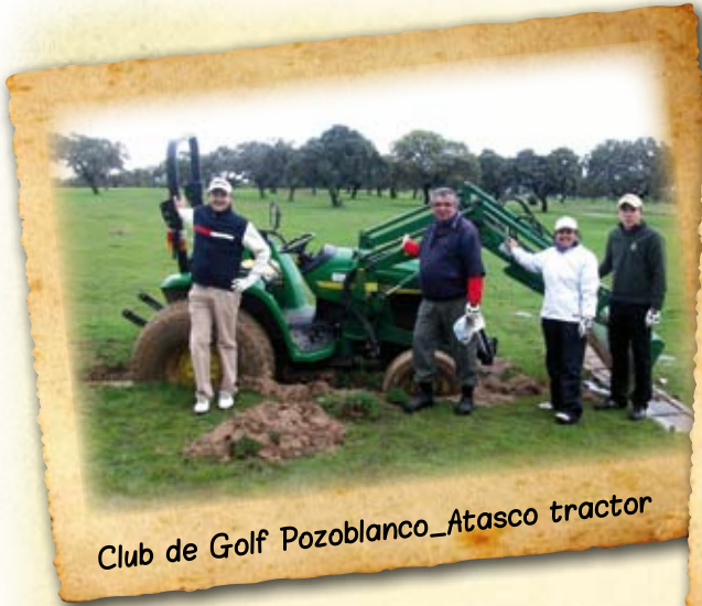
Club de Golf Pozoblanco_Atasco tractor