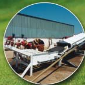
MÁQUINA PARA LAVAR TEPES