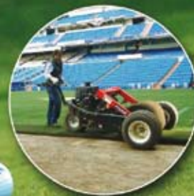
TEPES Y ESQUEJES CERTIFICADOS

3.000.000 m 2 de césped en producción FINCAS PRODUCTORAS