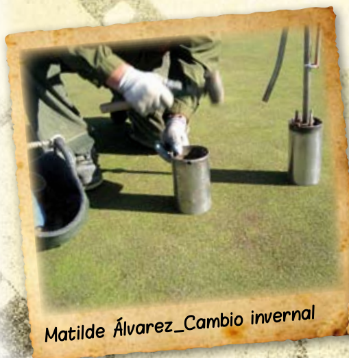
Matilde Álvarez_ Cambio invernral

Para fomentar la participación de sus asociados en esta sección, la AEdG premiará, coincidiendo con el próximo Congreso, la mejor fotografía publicada. Haznos llegar tus imágenes al email info@aegreenkeepers.com