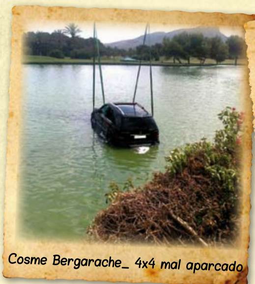
Cosme Bergarache_ 4x4 mal aparcado