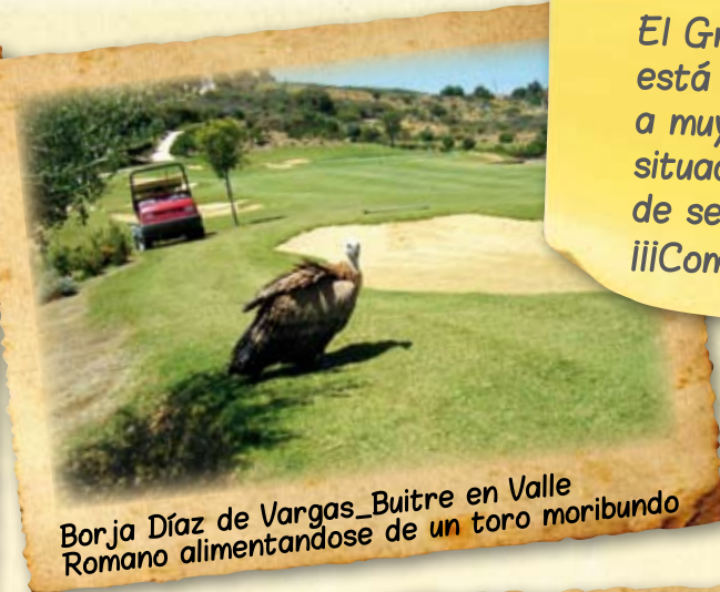
Borja Díaz de Vargas_ Buitre en Valle Romano alimentandose de un toro moribundo

El Greenkeeper está expuesto a muy diversas situaciones dignas de ser captadas. ¡¡¡Compártelas!!!