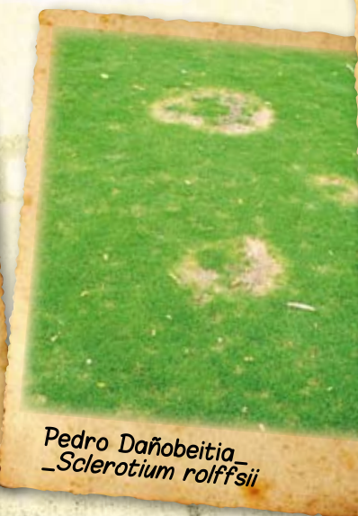
Pedro Dañobeitia_ Sclerotium rolffsii