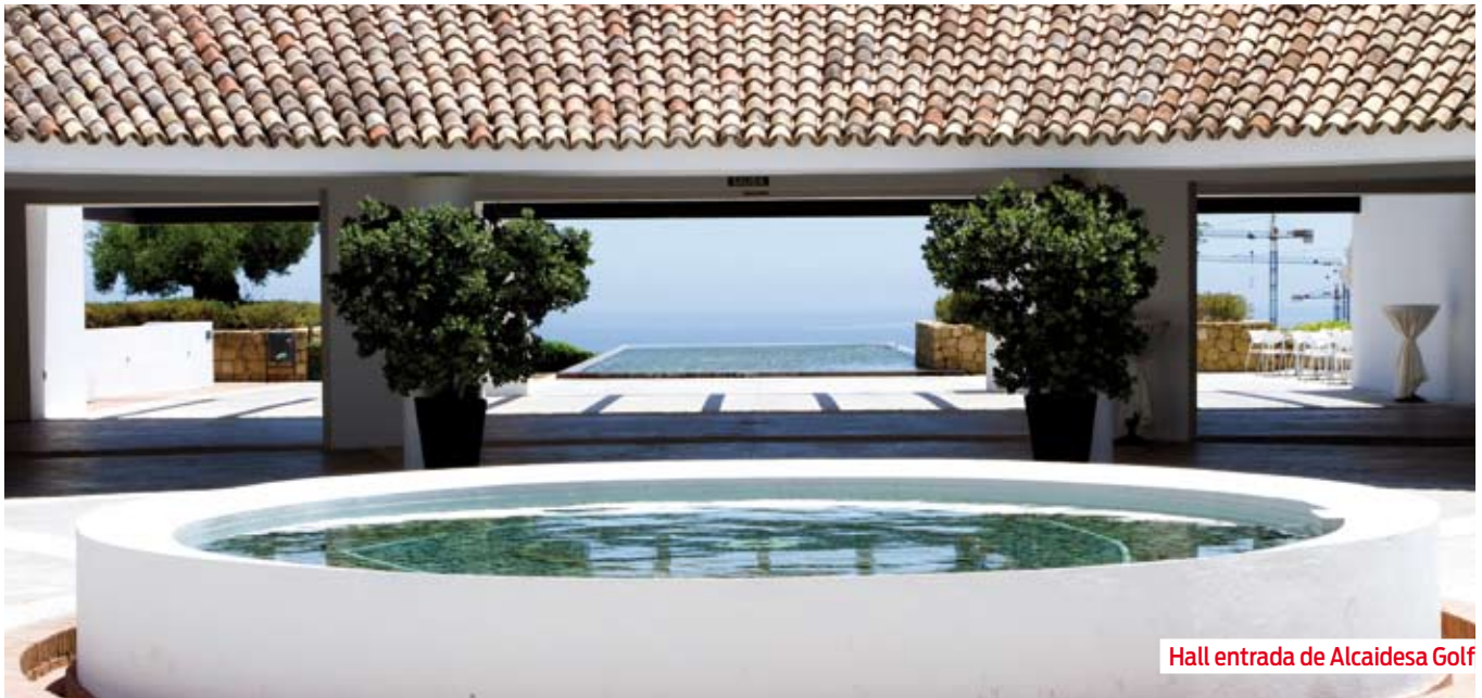
Hall entrada de Alcaidesa Golf