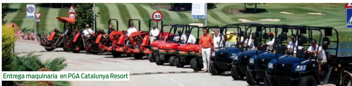
Entrega maquinaria en PGA Catalunya Resort