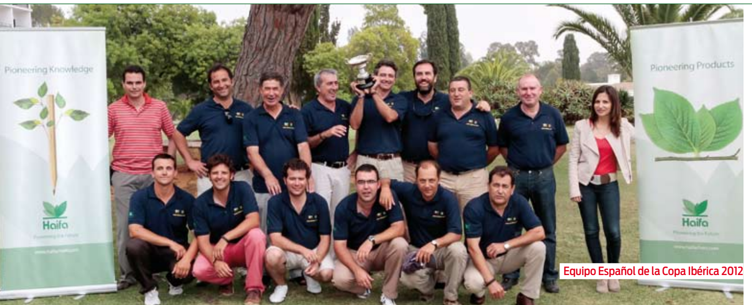
Equipo Español de la Copa Ibérica 2012