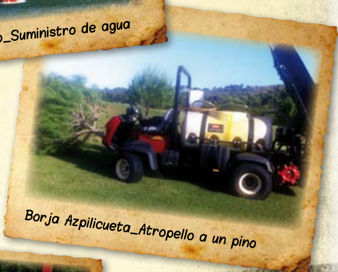
Borja Azpilicueta_Atropello a un pino

El Greenkeeper está expuesto a muy diversas situaciones dignas de ser captadas. ¡¡¡Compártelas!!!