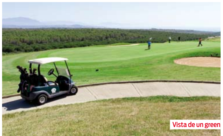
Vista de un green

Con idea de conocer su opinión y poder mejorar en los próximos años la organización del Torneo, la AEdG realizó una encuesta entre todos los asistentes al evento donde preguntaba sobre la época de celebración si era la más óptima o se prefería otra, el campo en el que preferían jugar el año que viene, y por último si se estaba satisfecho con la organización y los premios que se entregan, concluyendo que en general todos están de acuerdo con la fecha en la que se celebra el evento, que el campo más votado para disputar el Torneo el año que viene ha sido Golf El Puerto, y que en general se está satisfecho con la celebración del