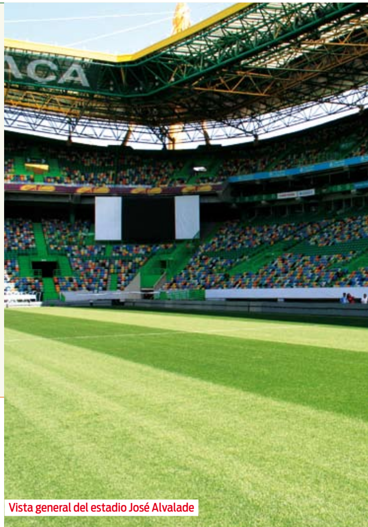
Vista general del estadio José Alvalade