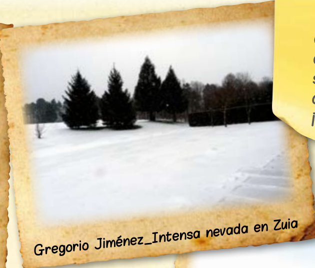
Gregorio Jiménez_Intensa nevada en Zuia