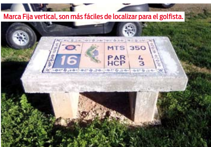
Marca Fija vertical, son más fáciles de localizar para el golfista.

anterior) algunos clubes optan por indicar en las marcas fijas, los metros del hoyo y en algunos casos el hándicap del hoyo e incluso el par. Es una buena referencia para el golfista pero hay que tener en cuenta que si cambiamos alguna de esa información deberemos cambiar las marcas fijas. No es muy común cambiar la longitud o el par de los hoyos pero sí que se suele cambiar el hándicap de los hoyos, especialmente en los campos nuevos en los que al principio no se tienen estadísticas