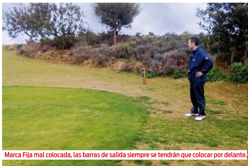
Marca Fija mal colocada, las barras de salida siempre se tendrán que colocar por delante.

EN CADA ARTÍCULO PUBLICAREMOS un pie de página con las definiciones de las palabras referidas al Sistema de Hándicaps para que en caso de duda las puedas consultar sin necesidad de recurrir a otros artículos o al Manual del Sistema de Hándicaps. Las palabras que tengan definición, parecerán en cursiva en el artículo.