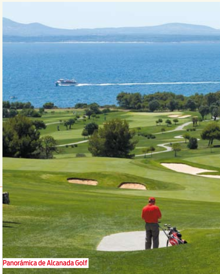
Panorámica de Alcanada Golf