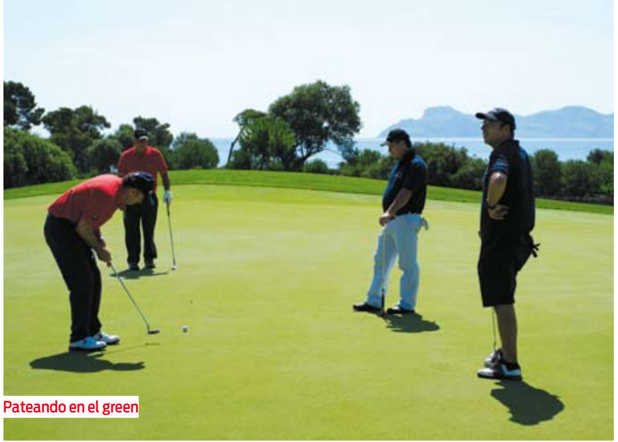
Pateando en el green

Anualmente el equipo de trabajo de HAIFA se moviliza para facilitar la organización de la Copa Ibérica, ya sea en España o Portugal, colaborando con la asociación anfitriona de forma destacada