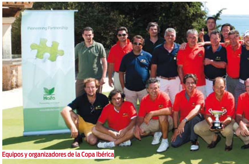
Equipos y organizadores de la Copa Ibérica