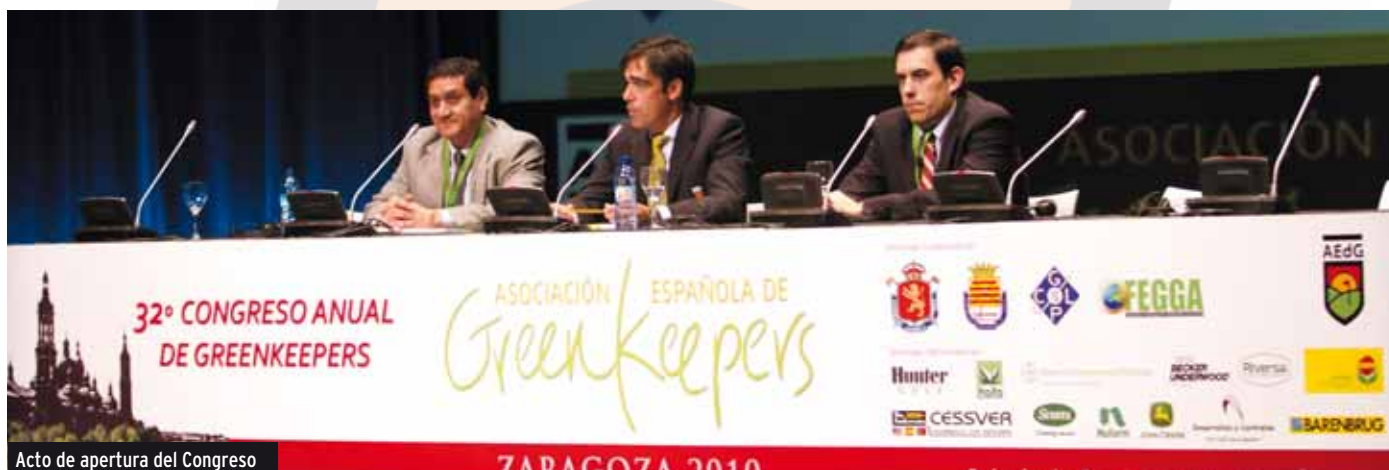
Acto de apertura del Congreso