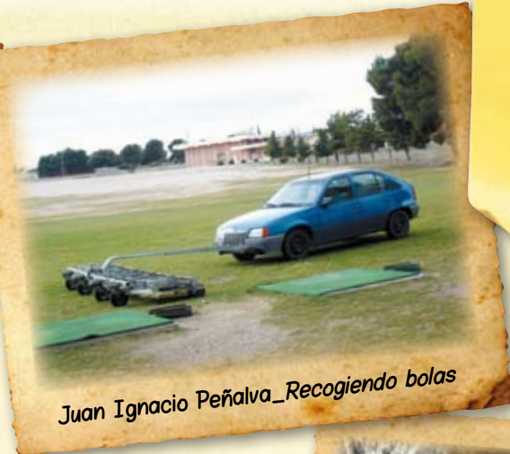
Juan Ignacio Peñalva_Recogiendo bolas

El Greenkeeper está expuesto a muy diversas situaciones dignas de ser captadas. ¡¡¡Compártelas!!!