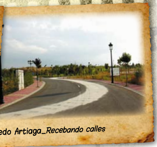
Alfredo Artiaga_Recebando calles