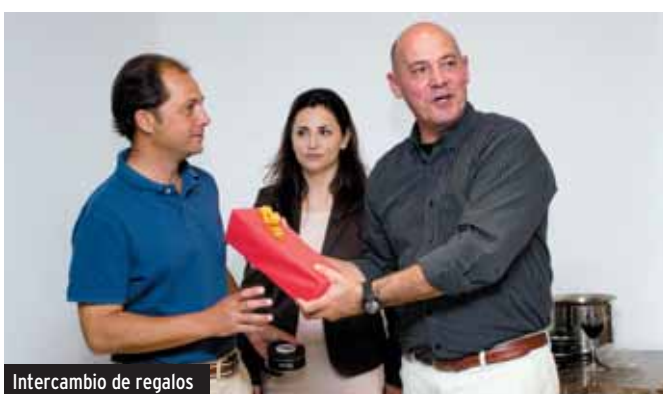
Intercambio de regalos