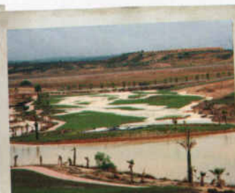
Inundaciones afectando a Ochando Golf (Murcia)