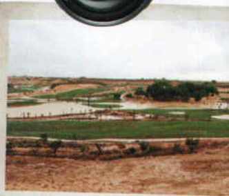
Inundaciones afectando a Ochando Golf (Murcia)