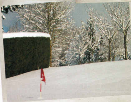
Nevada en Zuia Club de Golf