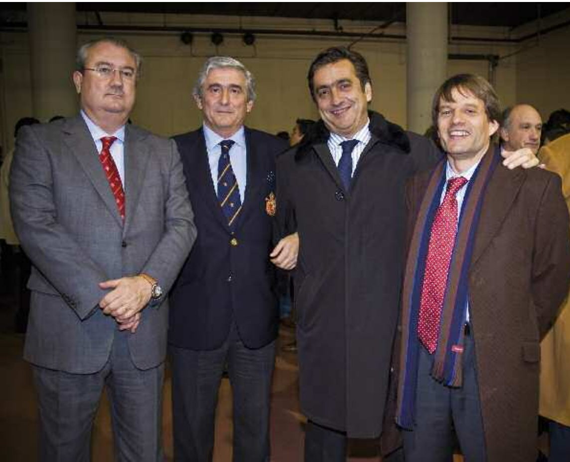
Muestra de aizkolaris, uno de los deportes rurales más populares en el País Vasco.