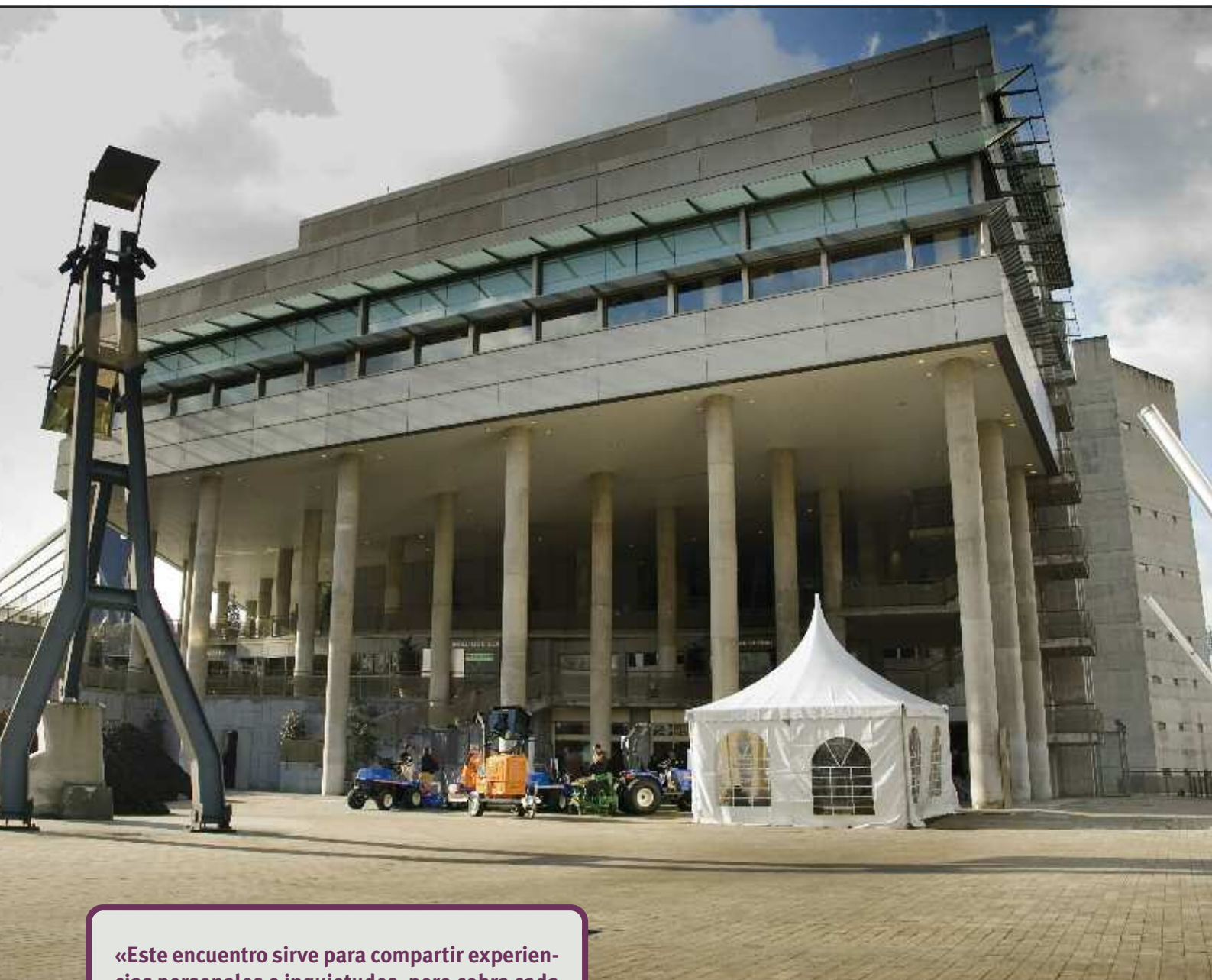
Palacio Euskalduna de Bilbao.

«Este encuentro sirve para compartir experiencias personales e inquietudes, pero cobra cada vez más peso la formación, lo que se traduce en un esfuerzo económico muy importante para contar con los mejores ponentes de ámbito internacional», explica Muñoyerro. Además, el