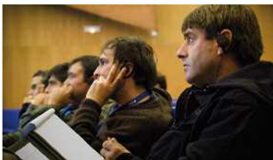
Asistentes a los seminarios-