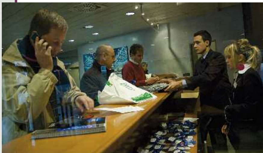
Presentando las inscripciones para acceder al congreso.