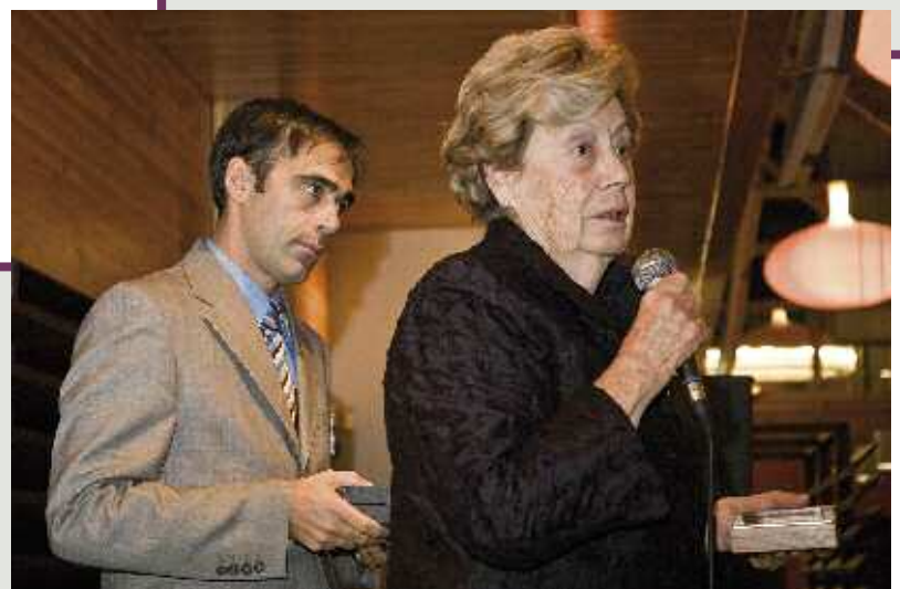
Emma Villaceros Presidenta de la Real Federación Española de Golf.