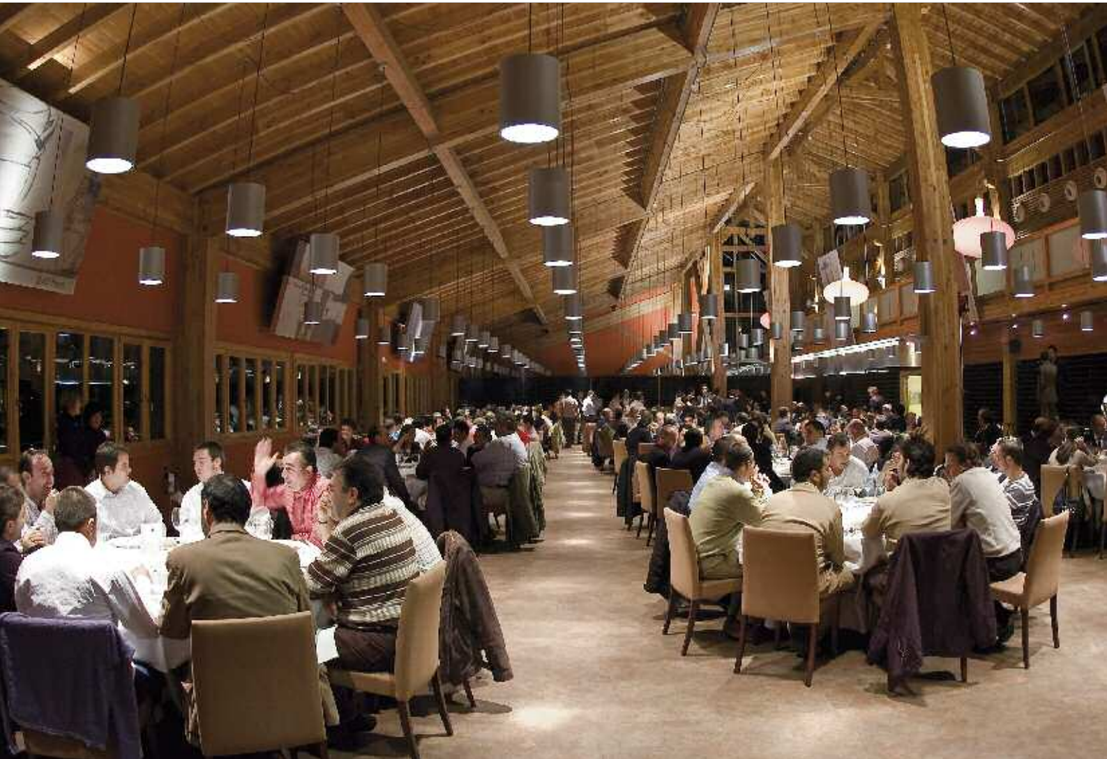
Cena en el restaurante Azurmendi.