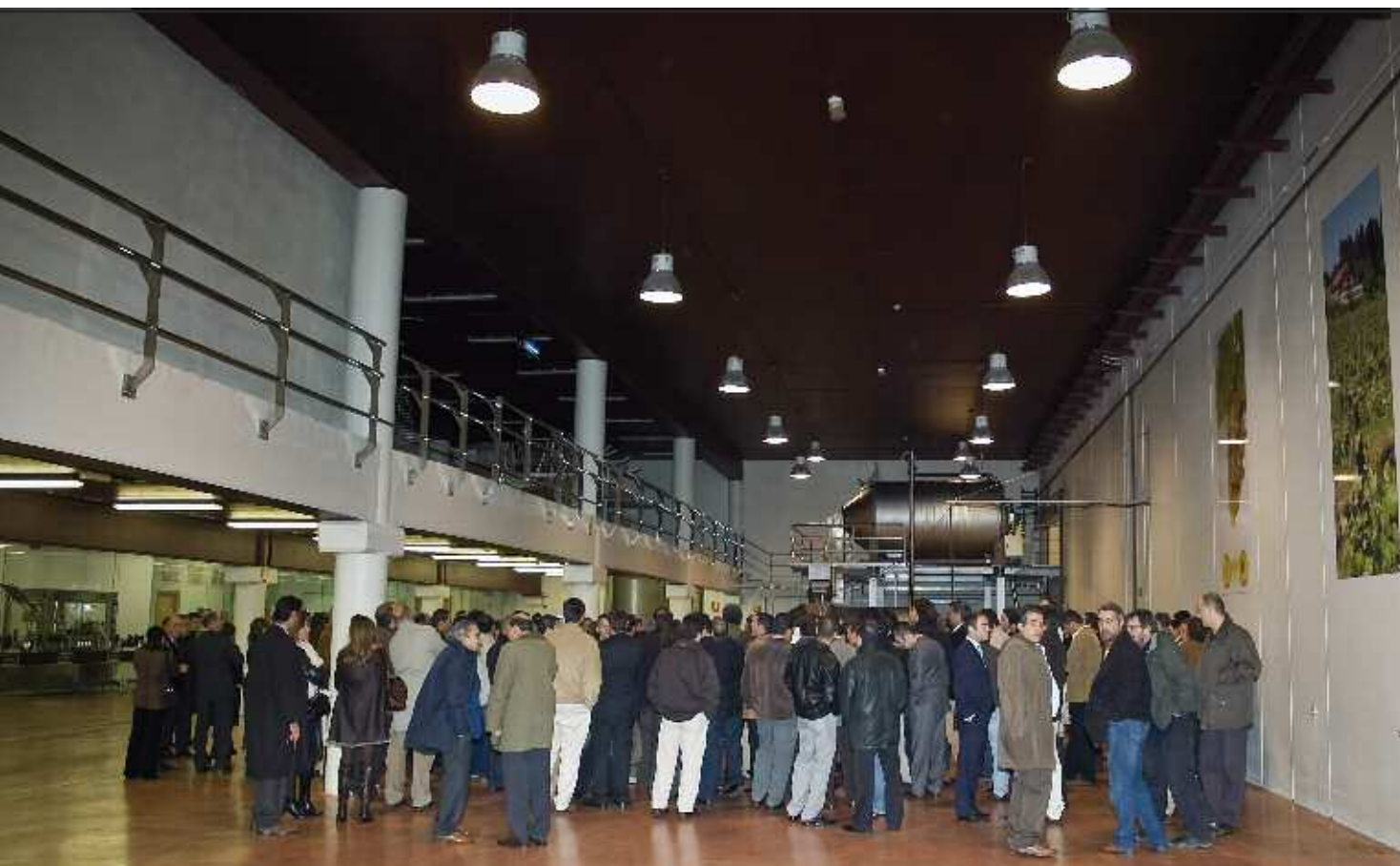
Dentro de las actividades programadas del jueves 27 de noviembre, los socios de la AEdG visitaron las bodegas de txakoli del restaurante Azurmendi, en Larrabetzu (Vizcaya).