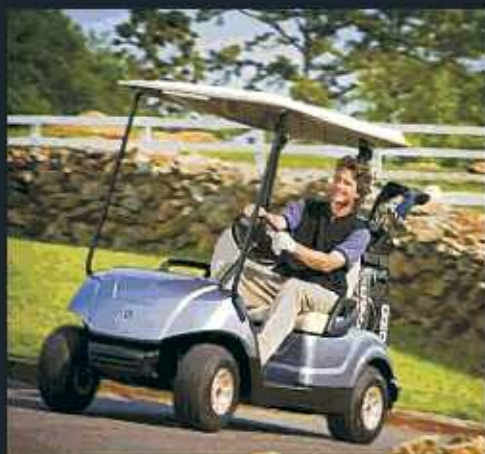
Nuevo YAMAHA G29 Electric-Gasolina 7 colores metalizados