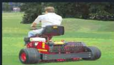
VERTI-DRAIN Autopropulsada Modelo 7007 Especial para greenes.