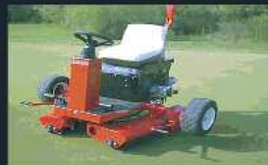
Rulo para greenes SMITHCO modelo Tournament Ultra-4