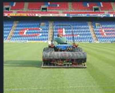
Aireadoras/descompactadoras VERTI-DRAIN Una amplia gama de anchuras y rendimientos de trabajos