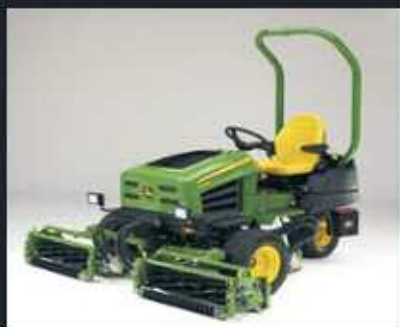
Tripleta JOHN DEERE 2653B Unidades de 26" y 30" corte helicoidal