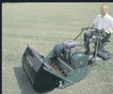
Segadoras manuales DENNIS de corte helicoidal