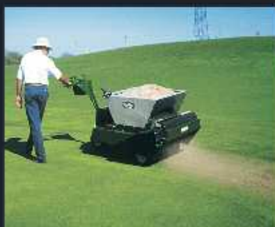
Recebadoras TURFCO manuales y de arrastres con sistema METE-R-MATIC