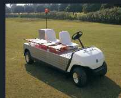
Coche ambulancia-campo de futbol FABRICADO POR HIPERGOLF a medida