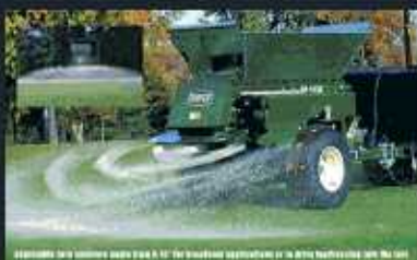
Recebadoras TURFCO con sistemas de discos WIDE SPIN de arrastre y sobre multusos (Todas las marcas)