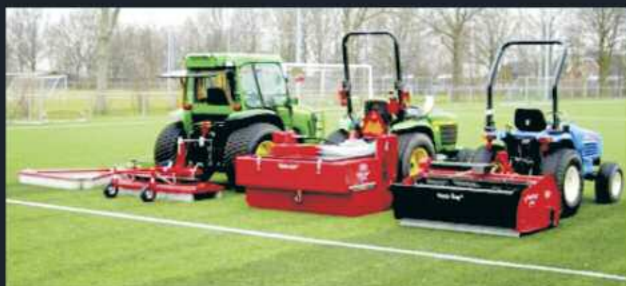
Gama completa de maquinarias para el mantenimiento de todo tipo de cesped artificial. CEPILLO DE ARRASTRE. RELLENO DESCOMPACTADOR. NIVELADOR DE RELLENO