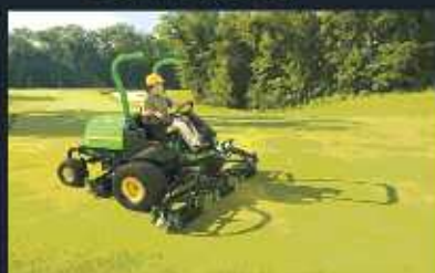
Ultima generacion de maquinas para calles JOHN DEERE Modelos 7000 y 8000