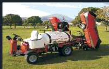
Vehiculo Fumigador con faldones SMITHCO modelo 1600