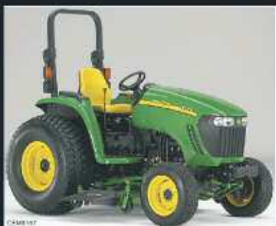
Tractores JOHN DEERE compactos de 25, 35 y 45 Cv