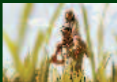
PARQUES Y JARDINES

Sistema probado científicamente que proporciona una nutrición equilibrada anual para todo tipo de céspedes.