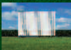
DEPORTES DE VERANO