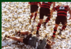
DEPORTES DE INVIERNO