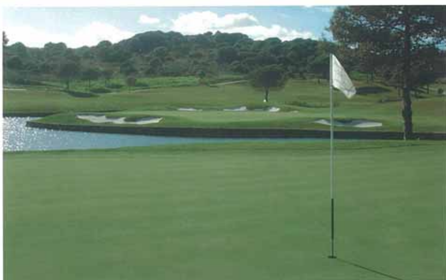
Figura 1. El césped de usos deportivos debe mantenerse con una alta calidad.

El césped deportivo utilizado en actividades tales como golf y fútbol (Figura 1), debe mantenerse con una alta calidad, buscando su funcionalidad y un aspecto que visualmente sea impecable. Factores como el color, estado sanitario, densidad, entre otros, son especialmente valorados por los usuarios de zonas verdes. Mantener un césped en equilibrio permite ofrecer una cubierta vegetal de calidad a aquellas personas que disfrutan de su tiempo practicando deportes o simplemente en sus momentos de ocio. A este respecto, una nutrición adecuada desempeña un papel fundamental.