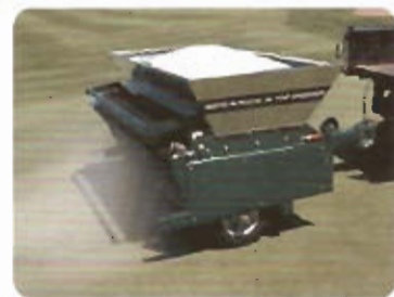
Recebadora de Arrastre Turfco mod. Mete-R-Matic XL