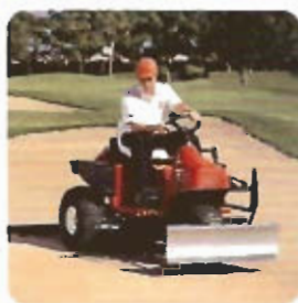
Moto Bunkers Smithco Super Rake Diesel 3WD