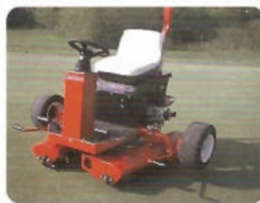
Rodillo Compactador de Greenes Smithco mod. X-Press