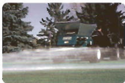
Recebadora de Arrastre Marca Turfco mod. Windespin 1530