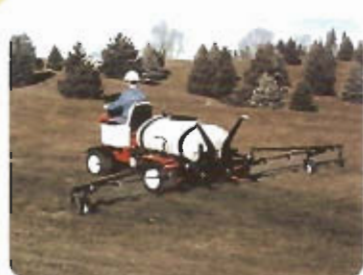
Vehículo de Fumigación Smithco Spray Star