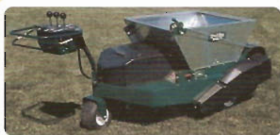
Recebadora Autopropulsada Marca Turfco mod. Mete-R-Matic F15B