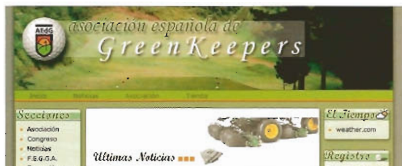
Cabecera de la nueva página web de la Asociación Española de Greenkeepers.

Desde hace unas semanas, está ya operativa la nueva página Web de la Asociación Española de Greenkeepers: www.aegreenkeepers.com