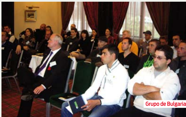
Grupo de Bulgaria.

una gran evolución, especialmente en Finlandia y Suecia. Ahora, el golf está empezando a tener más impacto en Estonia, así pues volvimos con gran entusiasmo con el primero de los tres Roadshows comprometidos en colaboración con el R&A. El objetivo de esta iniciativa es apoyar a los países emergentes en el mundo del golf, ayudándolos con todo lo necesario para crear una industria que respalde el juego del golf.