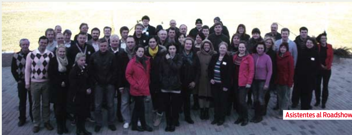
Asistentes al Roadshow.

En 1998 FEGGA visitó por primera vez Estonia, como parte de una visita a Suecia, Finlandia y Estonia. Desde entonces se ha producido