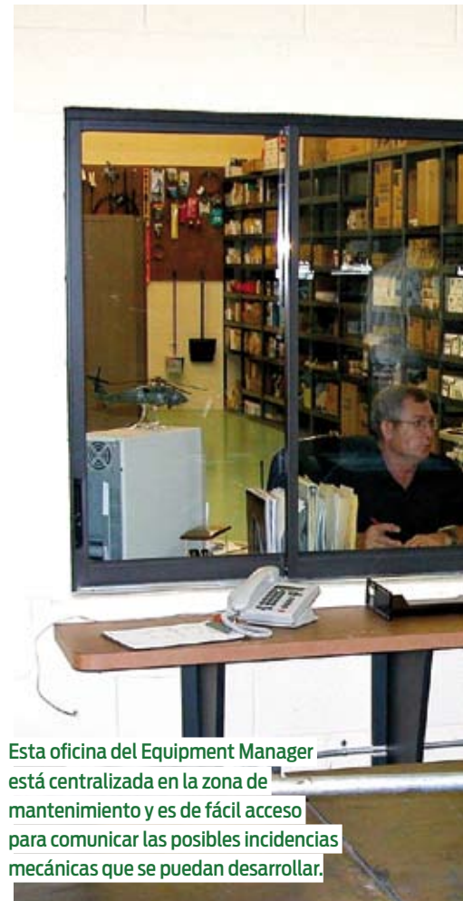
Esta oficina del Equipment Manager está centralizada en la zona de mantenimiento y es de fácil acceso para comunicar las posibles incidencias mecánicas que se puedan desarrollar.

El golf es un deporte que se juega sobre una superficie de césped mantenida a un cierto nivel de firmeza, velocidad, uniformidad y color, dependiendo de las expectativas del golfista y de los recursos disponibles. Un campo de golf bien mantenido ofrece una experiencia de golf agradable y