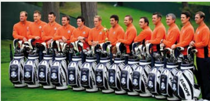
El capitán europeo para la Ryder Cup, el español José María Olazábal, posa para una foto de familia junto al resto de miembros del equipo europeo.