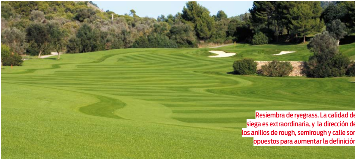
Resiembra de ryegrass. La calidad de siega es extraordinaria, y la dirección de los anillos de rough, semirough y calle son opuestos para aumentar la definición