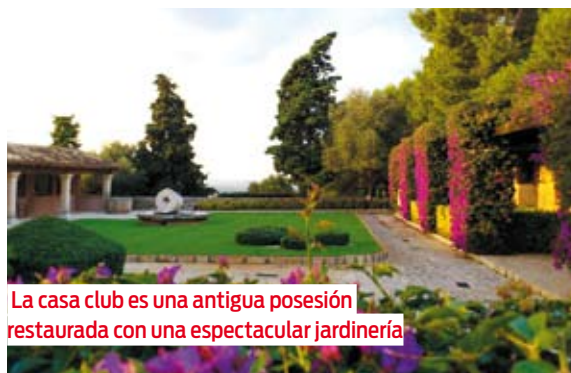
La casa club es una antigua posesión restaurada con una espectacular jardinería