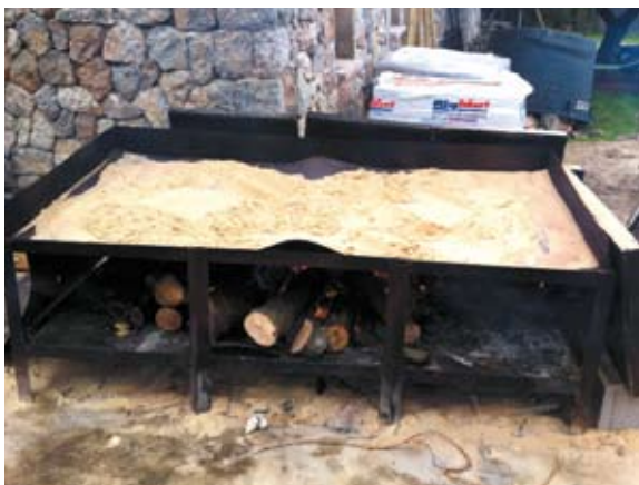
La arena de recebo es secada para poder aplicarla con abonadoras manuales. La arena seca es guardada posteriormente en un silo estanco.