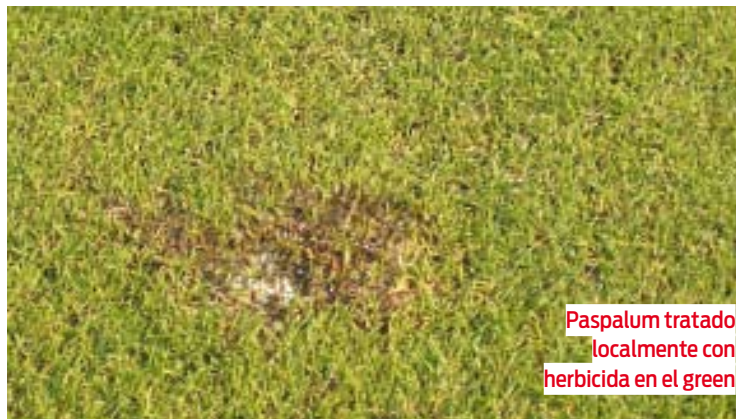
Paspalum tratado localmente con herbicida en el green