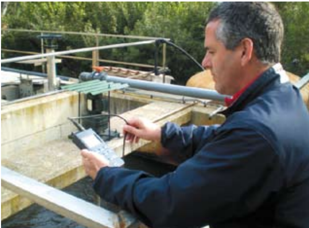
La medida de la salinidad y de la turbidez tiene una importancia capital en Golf Alcanada