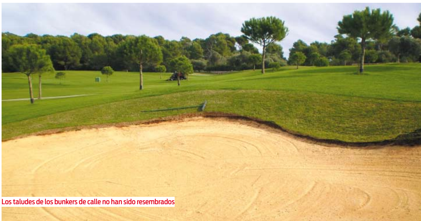
Los taludes de los bunkers de calle no han sido resembrados

El agrostis no llegaba a morir a pesar de pasar los veranos a 2,25 mm y con aguas salinas: “Observando la supervivencia del agrostis, pensaba que con el paso de los años tendría greens 100% SeaSide II en invierno con la ayuda de la resiembra cada otoño”, confiesa Borja. Tras tres años de intentar que funcionara la resiembra de los greens se llegó a la conclusión de que no podía seguir así.