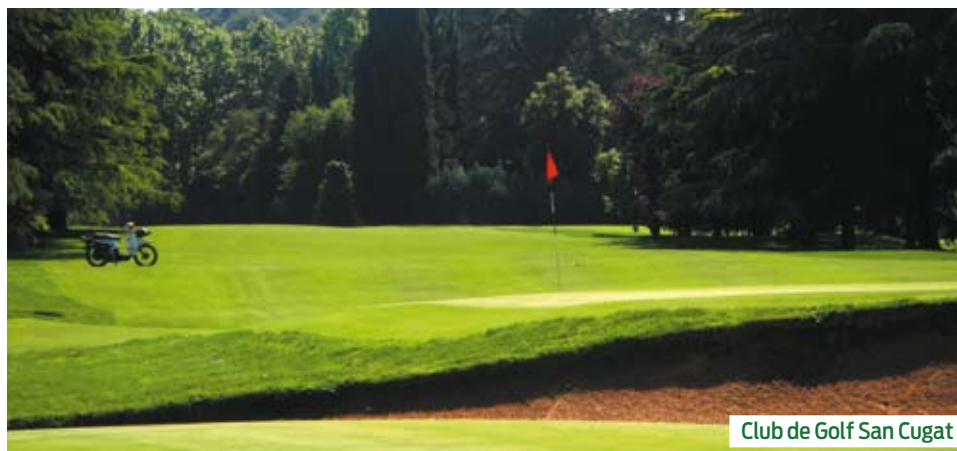
Club de Golf San Cugat

excelentes condiciones, nos informa de lo contento que está sembrando, en calles y tees, una mezcla de Raygrases , en concreto RAY VIP , que prácticamente le ha permitido eliminar la Poa annua implantada en el campo. Esta mezcla está compuesta de tres variedades: PARAGON GLR, PIZZAZZ Y GRAND SLAM . No únicamente le impacta el precioso color que obtiene, sino también la textura de la hoja que crea un césped denso y su gran resistencia a las enfermedades. Además nos incide en la rapidez con la que regenera y la baja altura de corte que permite.