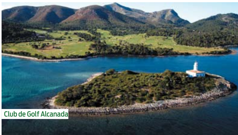
Club de Golf Alcanada