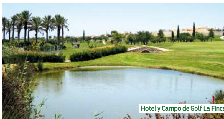
Hotel y Campo de Golf La Finca

dactylon para antegreenes, calles y tees, al ser una especie muy resistente a la sequía y a la baja calidad del agua. Dentro de esta especie, eligió la variedad PRINCESS 77 no sólo por su bonito color verde sino también por el menor consumo hídrico que necesita con respecto a otras variedades. Lo tiene claro, la variedad PRINCESS 77 no tiene competencia.