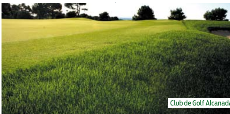
Club de Golf Alcanada