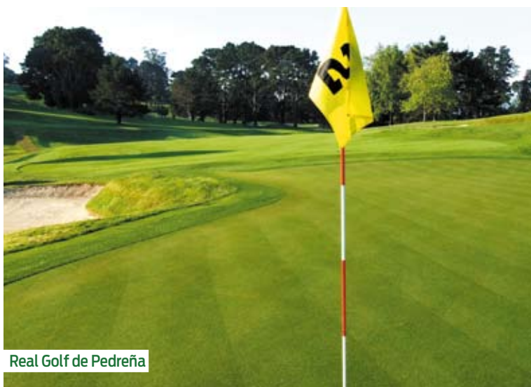
Real Golf de Pedreña