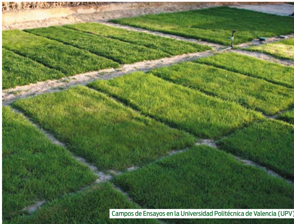
Campos de Ensayos en la Universidad Politécnica de Valencia (UPV)