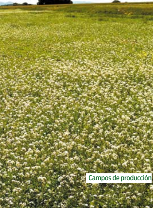
Campos de producción