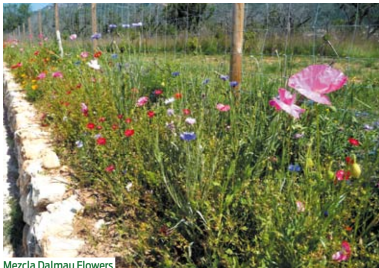
Mezcla Dalmau Flowers

Buena prueba de la confianza que nuestros clientes han depositado en la calidad y atención que siempre han obtenido de Semillas Dalmau, son los siguientes ejemplos: