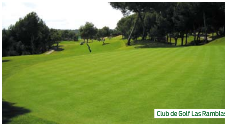
Club de Golf Las Ramblas

En cuanto a las variedades que utiliza para tener el campo en