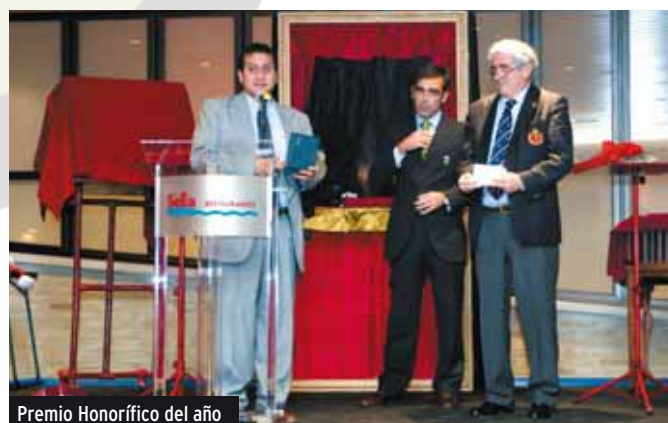
Premio Honorífico del año