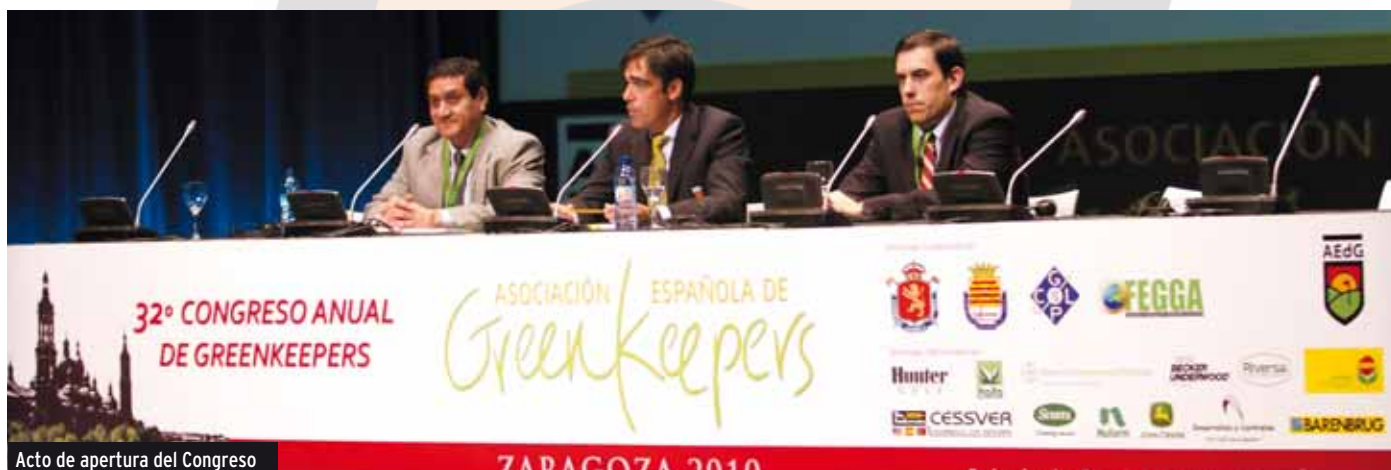
Acto de apertura del Congreso