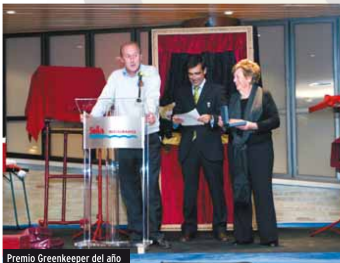
Premio Greenkeeper del año

La jornada del jueves culminó con nuestra tradicional Cena de Gala, que se celebró en el Restaurante El Sella. Los asistentes pudieron disfrutar de una agradable cena que estuvo amenizada por la brillante actuación del Mago Oliver, que contó con la inesperada colaboración de algunos de los presentes.