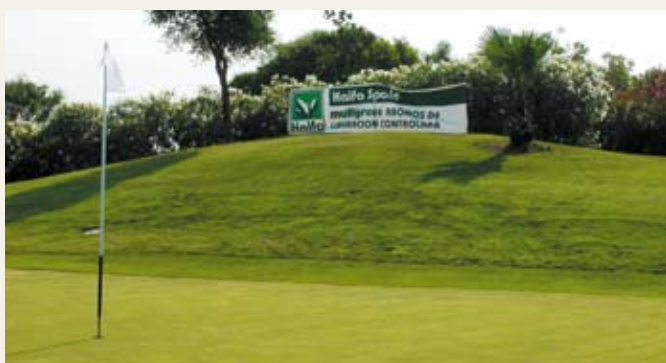
Figura 1. El césped de usos deportivos debe mantenerse con una alta calidad

Los procesos de producción de HAIFA cumplen las normas internacionales más exigentes sobre calidad y seguridad. La fabricación en HAIFA cumple las normas ISO 9001 (calidad), ISO 14001 (medio ambiente) y OHSAS 18001 (seguridad y salud en el trabajo).