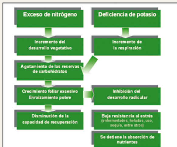
Figura 3. Importancia de la relación N:K

HAIFA CHEMICALS LTD. Fertilizantes Químicos S.A. C/ Gonzalo de Córdoba, 2 - 2ª planta 28010 Madrid Tel.: +34-91 591 21 38 Fax: +34-91 591 25 52 E-mail: office@ferquisa.es www.haifachem.com