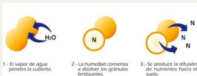
Figura 2: Mecanismo de liberación controlada de un fertilizante encapsulado con polímeros biodegradables.

En la línea de productos Multigreen®, una fracción del nitrógeno y del potasio se encuentra recubierta de forma regular por una resina polimerizada. Esta cubierta está formada por una trama cerrada de cadenas moleculares que por debajo de 5°C no presenta ninguna porosidad. A partir de 5°C, la cubierta biodegradable se empieza a dilatar creando una microporosidad que va a permitir la absorción de humedad y la dilución de los nutrientes, liberándolos de forma controlada y gradual conforme la temperatura y por tanto las necesidades de las plantas, van aumentando (Figura 2). La liberación de nutrientes está por tanto regulada únicamente por la temperatura del suelo. La resistencia de la cubierta va a mantener la integridad de las partículas a lo largo del tiempo y de la manipulación.