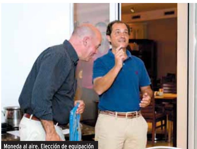
Moneda al aire. Elección de equipación