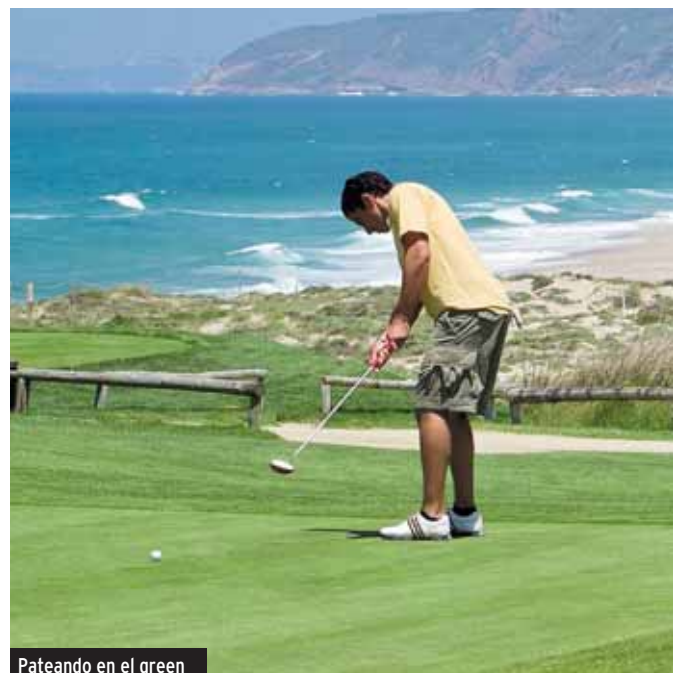
Pateando en el green