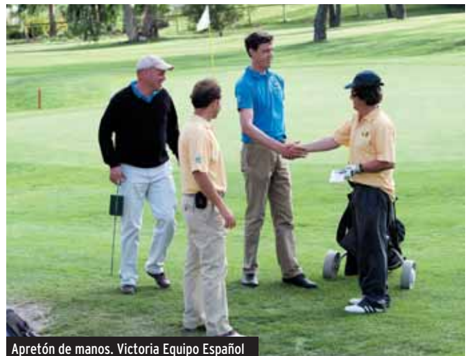
Apretón de manos. Victoria Equipo Español