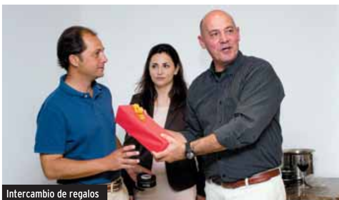
Intercambio de regalos