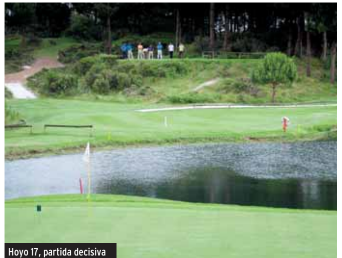
Hoyo 17, partida decisiva