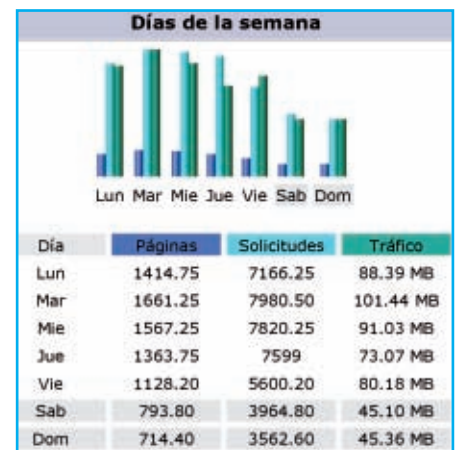
Figura 2: Ejemplo de distribución de las visitas a lo largo de la semana

El año 2.006 para la Asociación Española de Greenkeepers ha sido sin duda el año del crecimiento. Este crecimiento es fácilmente medible en el número de Asociados y en este sentido arrancamos el año con la noticia de que pronto romperíamos la barrera de los 400 Asociados entre Greenkeepers, Estudiantes, Colaboradores y Casas Comerciales y prácticamente sin darnos cuenta, según nos íbamos acercando a la celebración del Simposium de Sevilla tuvimos la agradable noticia de que ya no sólo habíamos superado estos 400 asociados sino que estábamos a punto de llegar a 500. Este crecimiento, fruto del trabajo de muchos años y de muchas Juntas Directivas supone un incremento del volumen de trabajo, de información, de presupuestos... y sobre todo de responsabilidad.