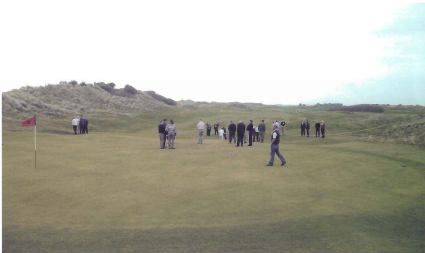
Grupo de delegados de FEGGA en las instalaciones de Portmarnock Links.

Durante el pasado mes de febrero se celebró la Conferencia anual de la Federación Europea de Asociaciones Nacionales de Greenkeeper (FEGGA). Esta conferencia tuvo lugar en el complejo Portmarnock Links en Dublín (República de Irlanda) y fueron organizadas por la Asociación de Greenkeeper de la República de Irlanda en cierta manera como homenaje al hasta el momento presidente de FEGGA, Joe Bedford y tal y como ocurrió en anteriores años, fue sponsorizada por Ransomes-Jacobsen. Como en ocasiones anteriores las conferencias se centraron en las líneas de trabajo de FEGGA, prestando especial atención al medio ambiente, la educación y la comunicación.