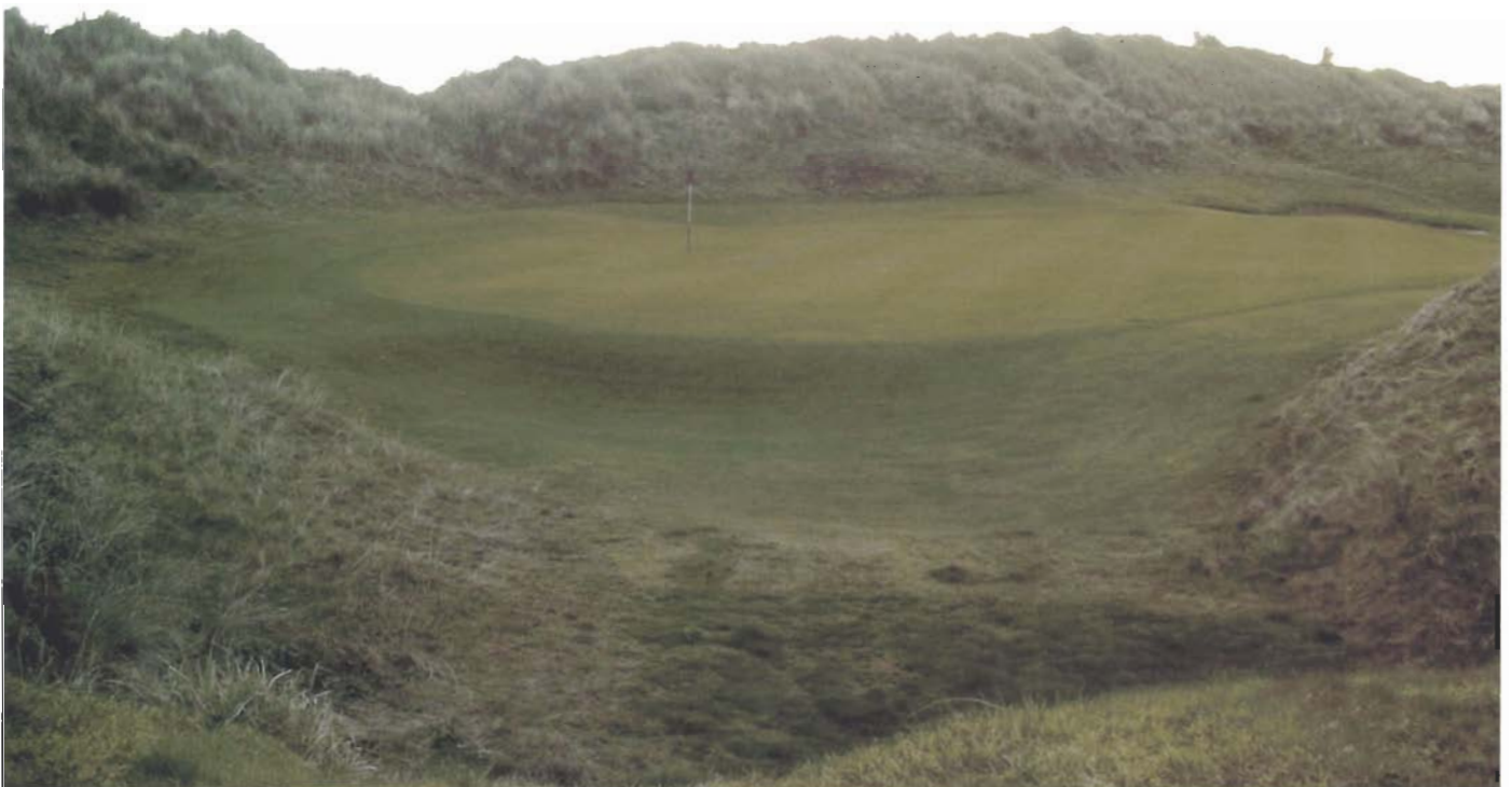
Instalaciones del Links.