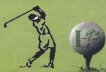
AGROSTIS STOLONIFERA L93