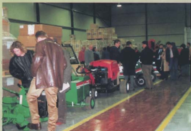
Los congresistas mostraron un gran interés por las máquinas que pudieron verse en el almacén de la firma.