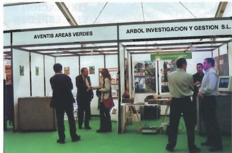
AVENTIS - ÁRBOL