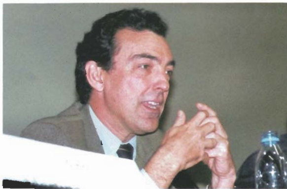
Xavier Civit, Director general de Turismo de la Generalitat de Catalunya, desvinculó en su intervención el interés urbanístico de la construcción de campos.

una muy completa oferta turística en cuanto a cultura, espectáculo, arquitectura y museística, así como una buena capacidad hotelera. El privativo precio del suelo fue el argumento del ponente al defender la tesis del imprescindible impulso por parte de la Administración para hacer realidad cualquier proyecto de construcción de un campo en la ciudad. A través de la exposición de una serie de planos y gráficos de la ciudad y los campos que en ella se encuentran, así como de los proyectos de campos de golf que se están desarrollando actualmente, Armada explicó las características de la gestión pública o privada de cada campo y la vinculación de la Administración tanto con unos como con otros. Armada destacó especialmente las características singulares de los campos que se están proyectando en Arroyo del Fresno, donde antes había ubicado un vertedero, atravesado además por la M-40, uno de los grandes cinturones de Madrid con un tráfico muy intenso, junto al que se está también proyectando la construcción de un nuevo barrio urbano; y del proyecto de la Vega del Manzanares, en la zona sur, donde están situadas todas las unidades de saneamiento de la ciudad, un campo que ha diseñado