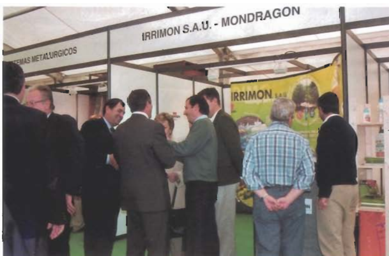
IRRIMON S.A.U. - MONDRAGÓN