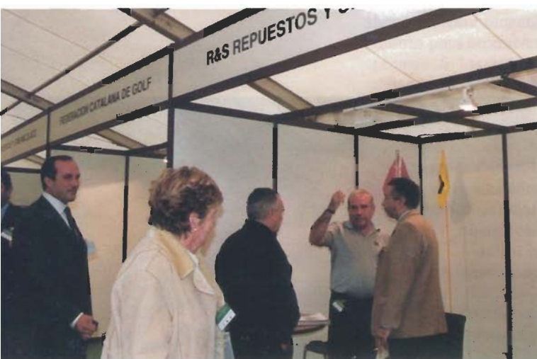
R&S REPUESTOS Y SERVICIOS.