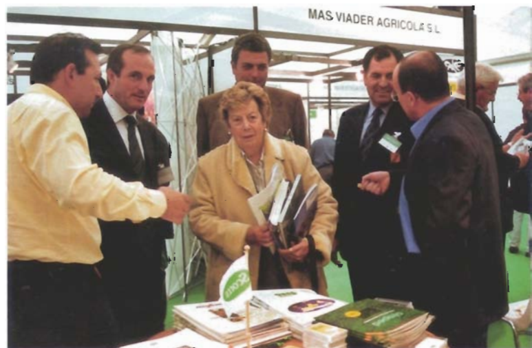
SEMILLAS FITÓ - SCOTTS