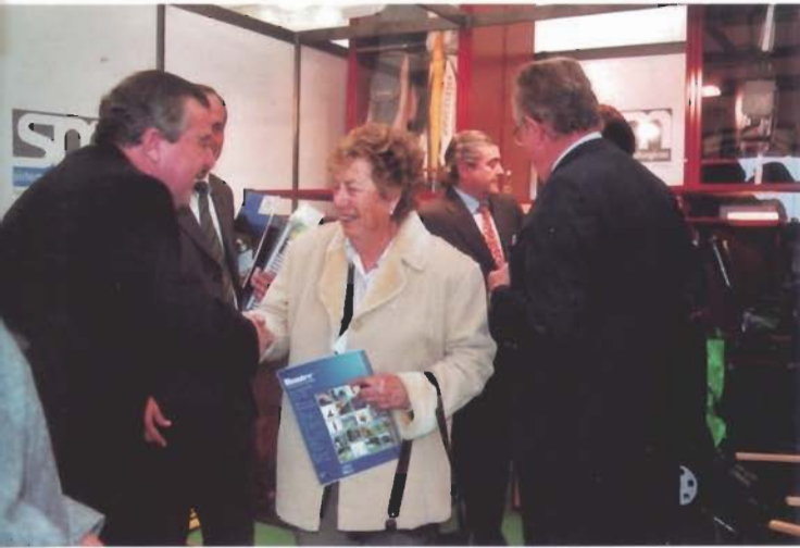
R.M. SISTEMAS METALÚRGICOS