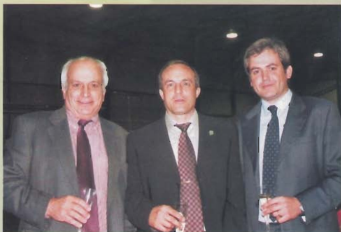
Directivos de ambas firmas dieron la bienvenida a los asistentes.