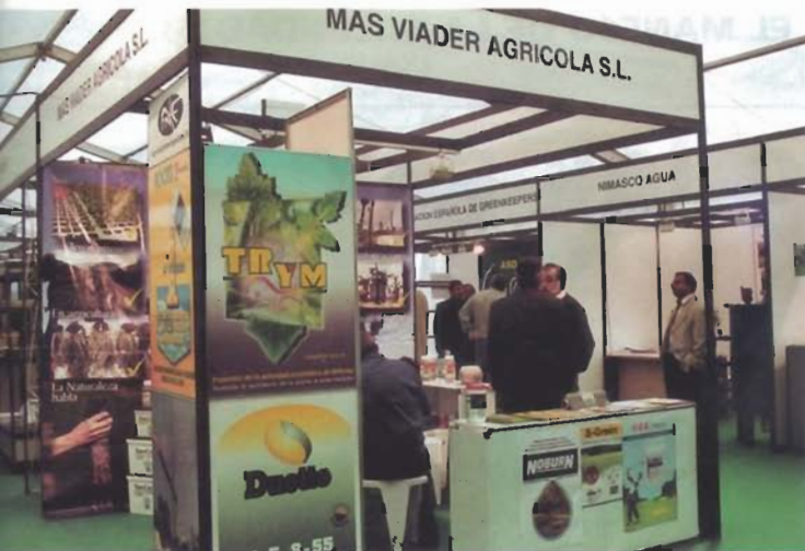
MAS VIADER AGRÍCOLA